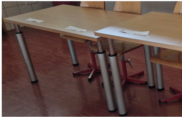
Pult, ca. 30-jährig

Die Pulte erreichen nun ein Alter, in welchem es schwierig wird, sie noch zu reparieren.